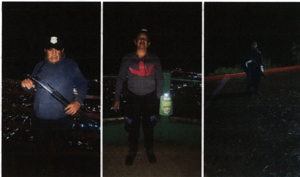
Foto 23-25: Personal de vigilancia para prevención de incendios forestales las 24 horas del día.

En época de lluvia desactivamos nuestro sistema de vigilancia contra incendios. Actualmente el personal de seguridad realiza patrullajes de rutina en los cuales verifica la ausencia de cualquier situación de riesgo desde los 3 miradores del parque.