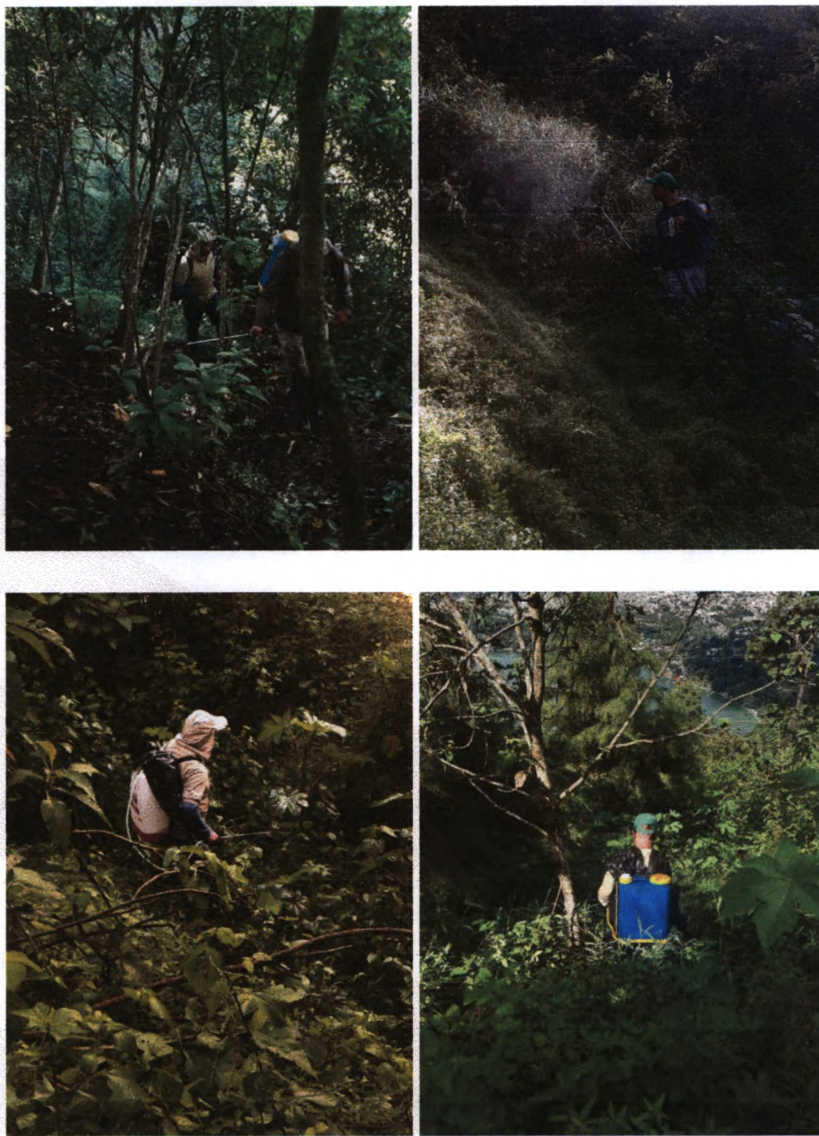
Foto 1-4: Mantenimiento del sistema de brechas cortafuego durante época lluviosa.

Durante agosto se concluyó esta primer ronda de mantenimiento, en los siguientes meses se continuará con labores de mantenimiento de reforestaciones y sitios en proceso de regeneración natural. Así como el programa de control y vigilancia