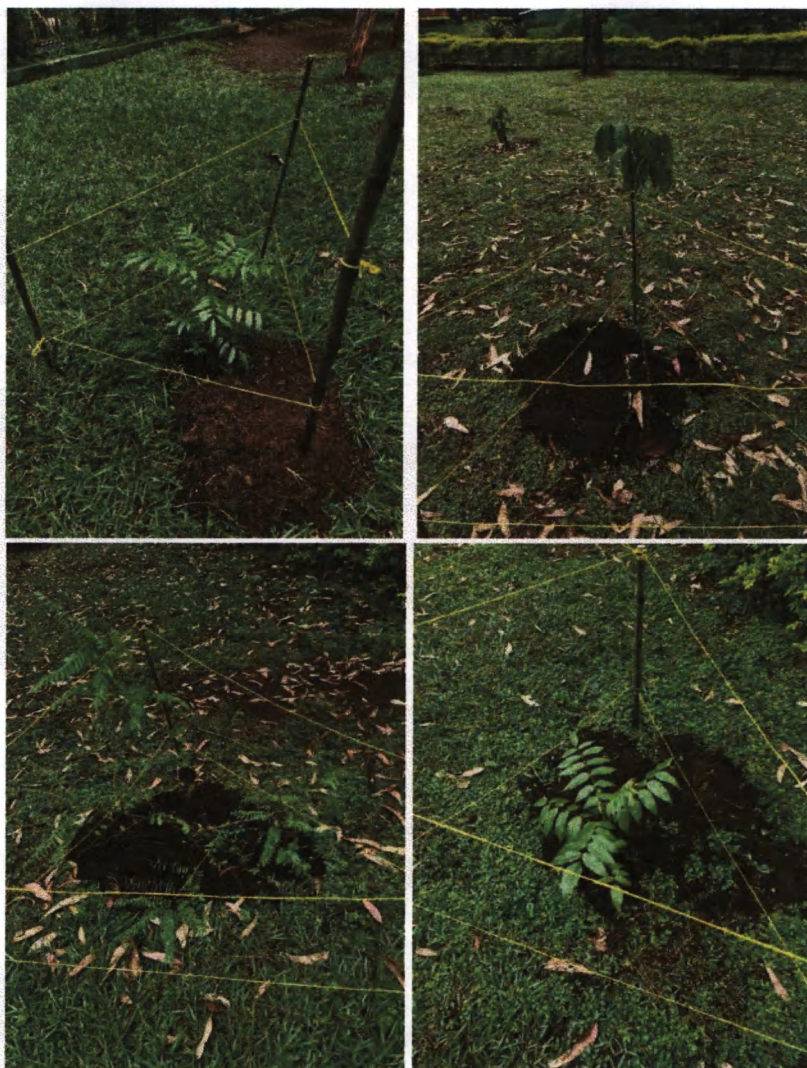
Fotos 9-12: Reforestación con especies nativas en la plaza turística de PNNU

Se realizaron las actividades de reforestación de 5 hectáreas ubicadas en la zona de uso intensivo del parque y en la zona de protección en un área afectada por una reciente invasión. Se utilizaron plantas producidas en el vivero del parque, de especies como Guachipilín, Matiliguaté, Cedro de altura, Timboque, Almendro Cimarrón y otras especies nativas. Durante agosto se reforestó un área en el kilómetro 24.7 de la carretera CA9Sur, donde se desalojó a unas personas que ocuparon ilegalmente para establecer un predio de camiones.