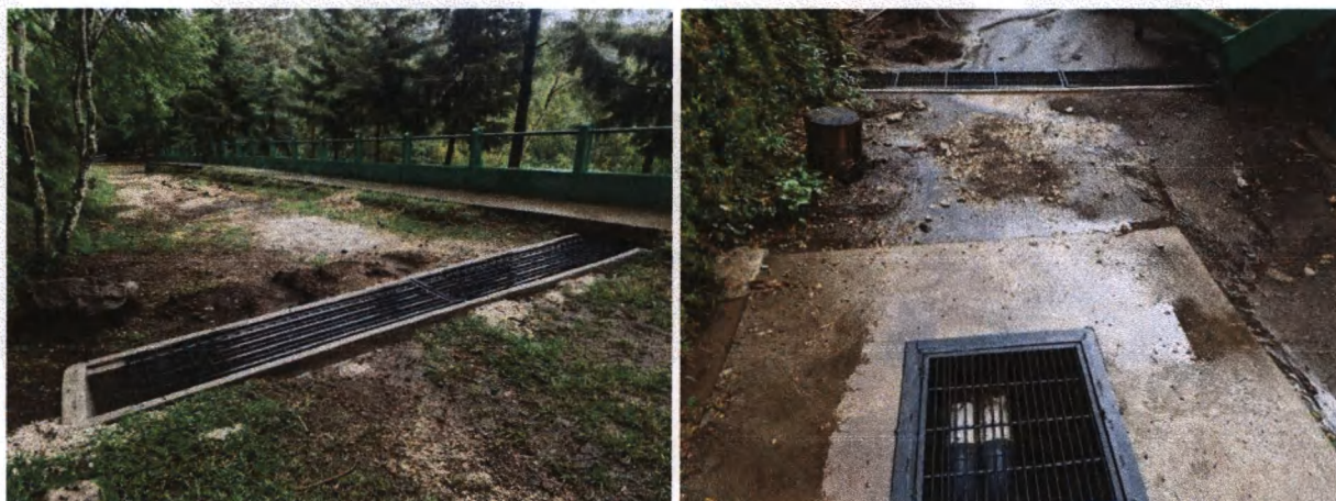
Foto 21-22: Zanja y pozo de absorción para conservación de suelo y manejo de agua pluvial en el mirador principal y granja educativa

Concluyeron las acciones de apertura de nuevas acequias y zanjas para la conservación de suelo y agua, en la granja educativa y el mirador principal.