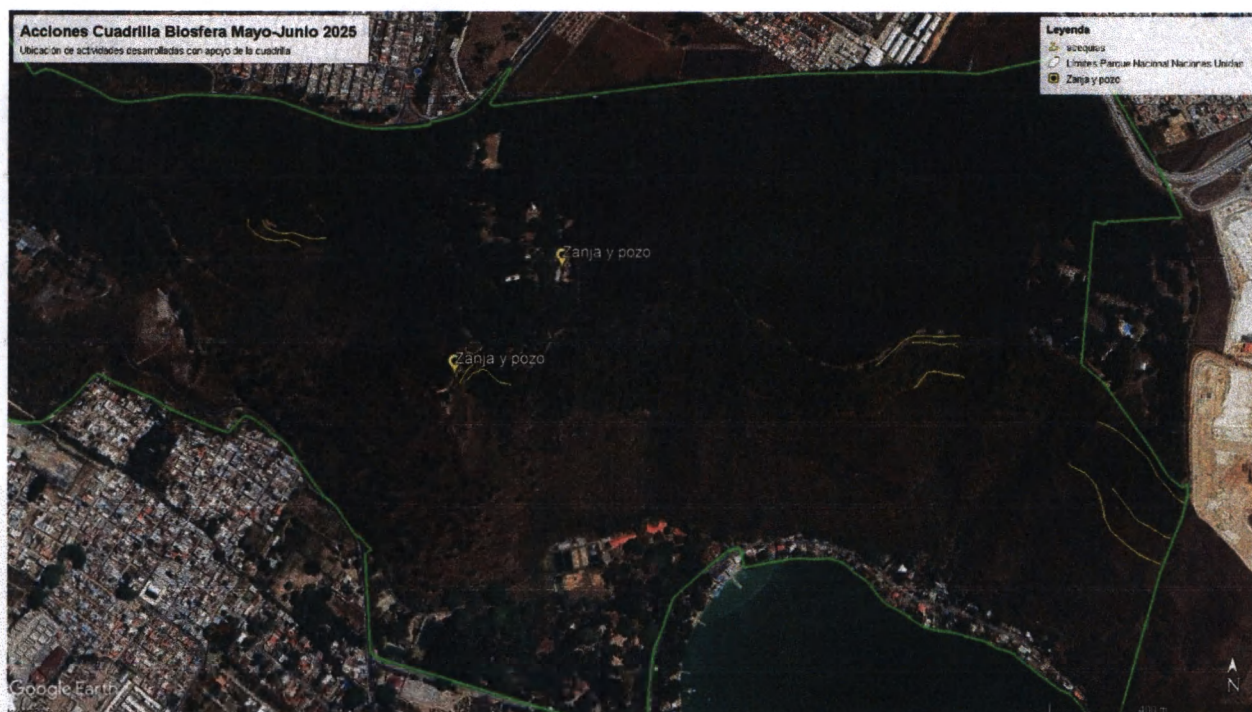
Mapa 2: Ubicación del sistema de acequias del PNNU.

Concluyeron las acciones de apertura de nuevas acequias y zanjas para la conservación de suelo y agua, en la granja educativa y el mirador principal.